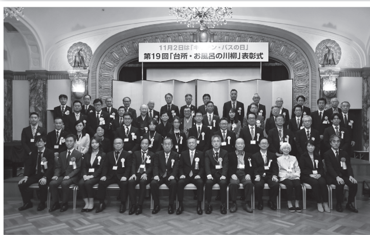
令和5年表彰式 風景 (第19回)