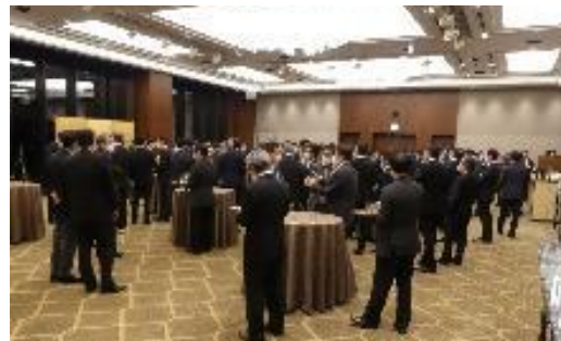
賀詞交歓会の様子