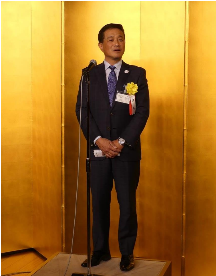
林会長による新年挨拶