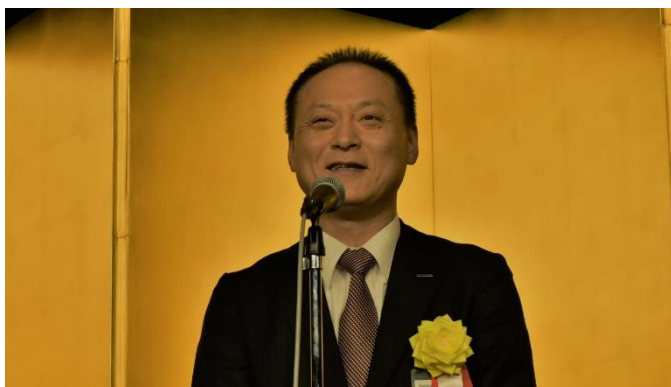
小早川副会長によるご挨拶と乾杯のご発声