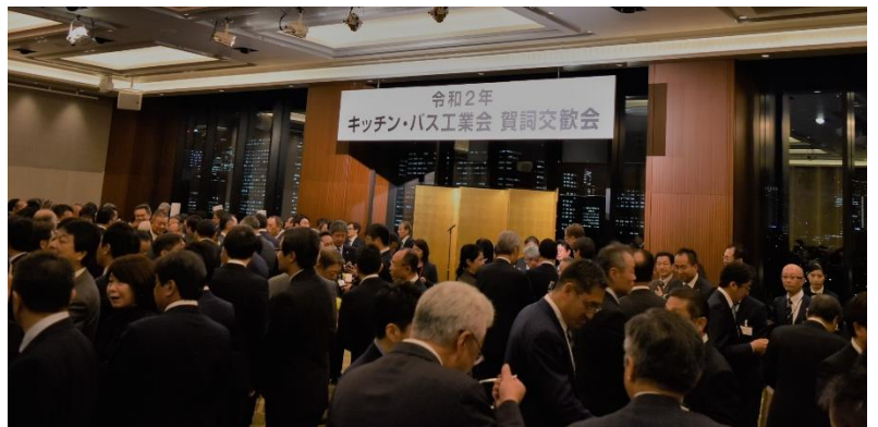
賀詞交歓会の様子