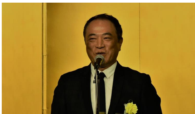
西田理事によるご挨拶と中締め