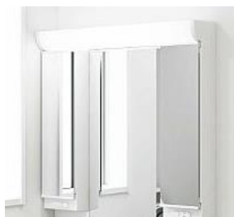
洗面化粧台の直管蛍光灯ランプの例