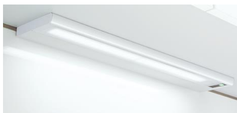
キッチン棚下灯の例

直管蛍光灯ランプを直管LEDランプに交換する場合は複雑な電気系統の適合を確認しないと発煙や火災の原因となる可能性がありますので、直管蛍光灯ランプは直管LEDランプに交換しないでください。