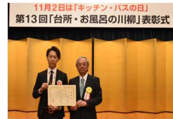
前年（第13回）大賞受賞の様子